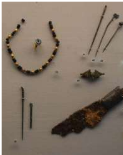
(objets mérovingiens trouvés dans les Yvelines – Musée de Saint-Germain en Laye)

Assurent le scellement d'une nouvelle société aux origines de la nôtre.